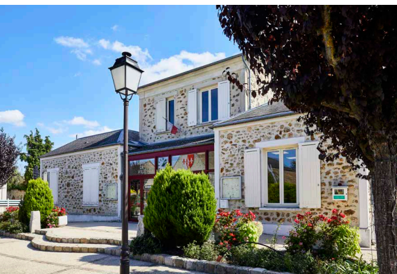
Mairie de Gometz-la-Ville