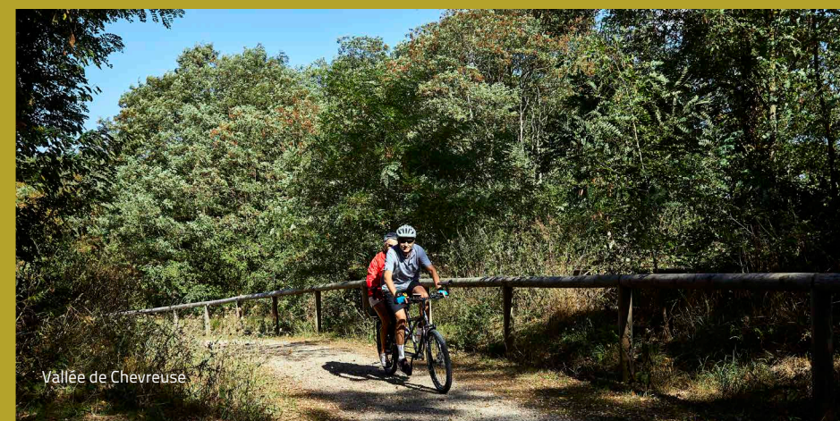
Vallée de Chevreuse