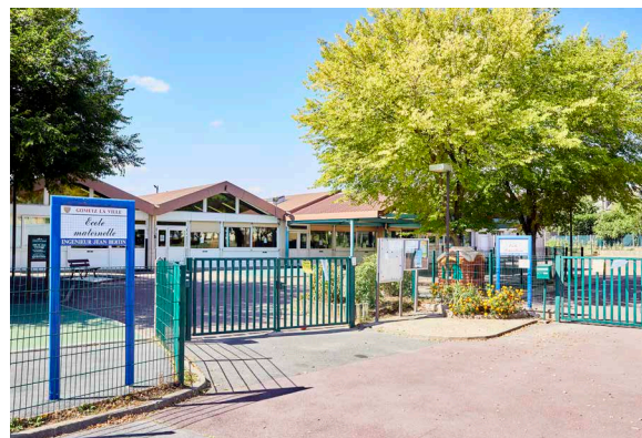
École maternelle Jean Bertin