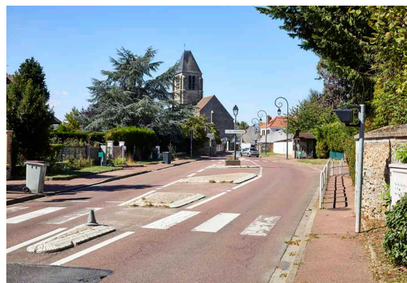
Rue de Janvry