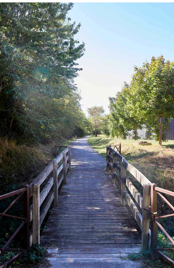
Lavoir de Gometz-la-Ville